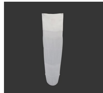
DAW Schutzhüllen Form E

Stand: 06. 2019 / Änderungen vorbehalten