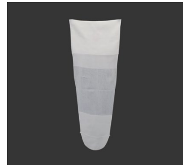
DAW Schutzhüllen Form D