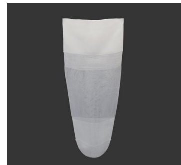
DAW Schutzhüllen Form A