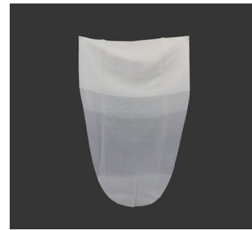
DAW Schutzhüllen Form C