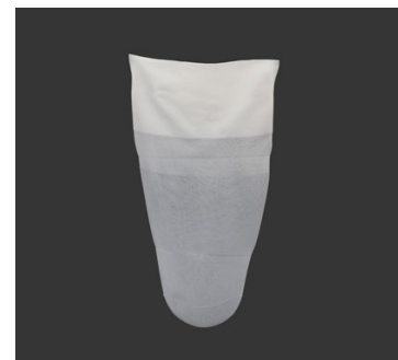
DAW Schutzhüllen Form B

> Weiterführung der Tabelle auf der nächsten Seite